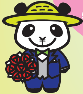
JAバンクえひめキャラクター ばんじゃくん