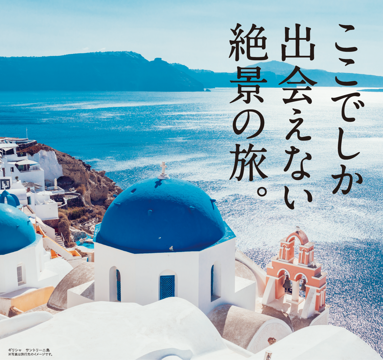
ギリシャ サントリーニ島 ※写真は旅行先のイメージです。